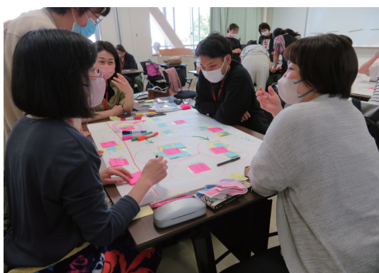
授業（グループワーク）の様子 看護教育に造詣が深い講師の講義・演習により、 教えること、学ぶことについて探究していきます。