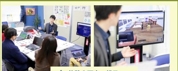
プレ体験企画会の様子